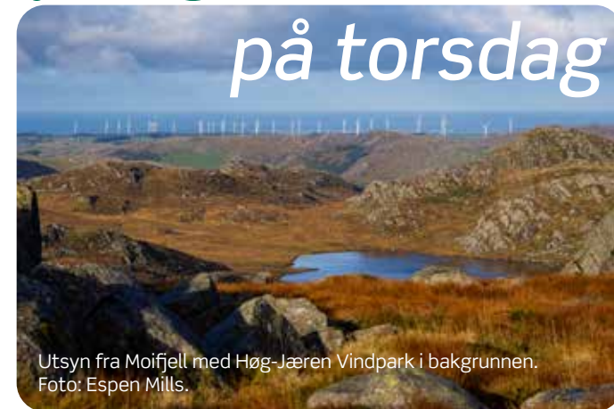
Utsyn fra Moiffjell med Høg-Jæren Vindpark i bakgrunnen.