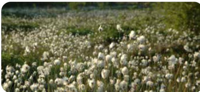
Ryggmyra i Randaberg, en av de siste gjenværende på Nord-Jæren.

Samtalekvelden arrangeres av Besteforeldrenes Klimaaksjon, Sør-Rogaland i samarbeid med Naturvernforbundet.