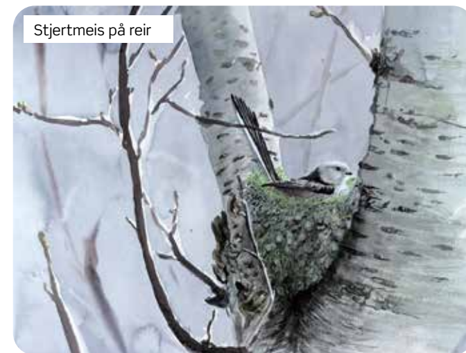
Stjertmeis på reir

Noen av maleriene hans vil bli stilt ut, og du vil ha muligheten til å kjøpe noen av dem i tillegg til trykk.